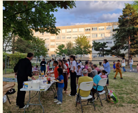
Projection du Roi lion (Jon Favreau, 2019) à Argenteuil, le 09/06/2023

Forte de son expérience de cinéma en plein air acquise au fil des festivals Ciné-Jardins et Ciné-Voisins, la fabrique documentaire est sollicitée par divers acteurs (collectivités locales, bailleurs sociaux...) pour organiser des projections conviviales dans l'espace public .