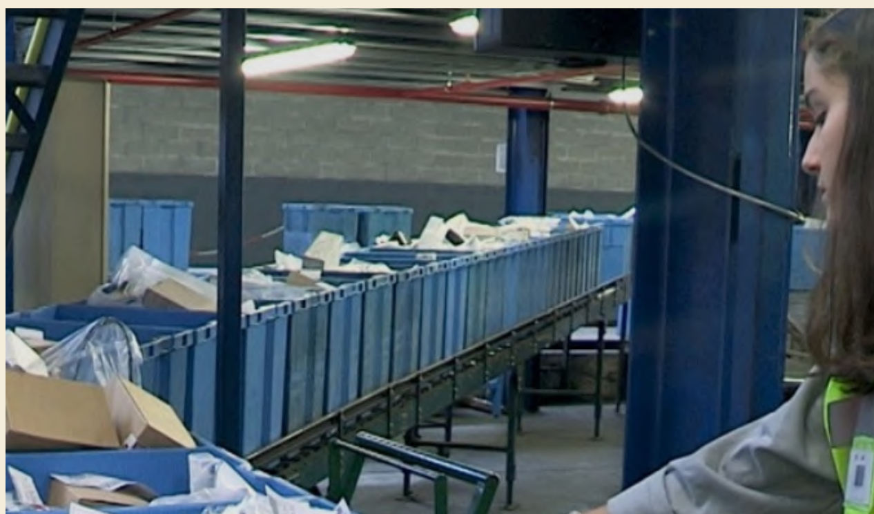
Etudiante de l'ESSEC en usine de tri des déchets dans le cadre de l'expérience terrain

La fabrique documentaire a enfin développé sa participation aux entretiens d'admission à l'ESSEC : intervenant sur l'ensemble des filières d'intégration (concours Grande école, concours Sesame, admissions sur titre, étudiants internationaux), elle a accompagné le département des Admissions dans une refonte des entretiens du BBA. Intégrant davantage les notions de veille technologique, d'entreprise responsable et d'objectifs de développement durable, le déroulé de ces entretiens est aujourd'hui davantage en phase avec les nouveaux objectifs pédagogiques de l'ESSEC.