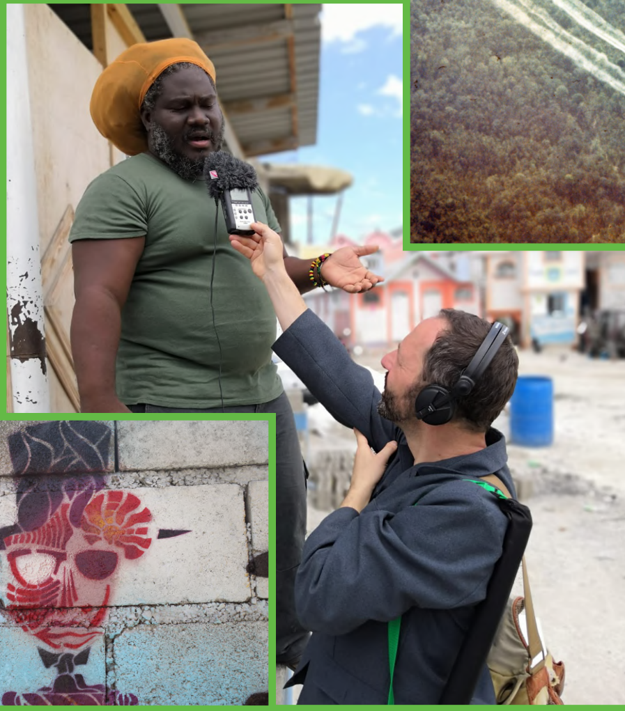
Port-au-Prince, chercher la vie