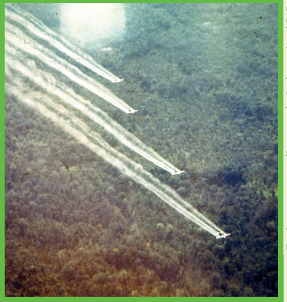
Environnement, climat et droits humains