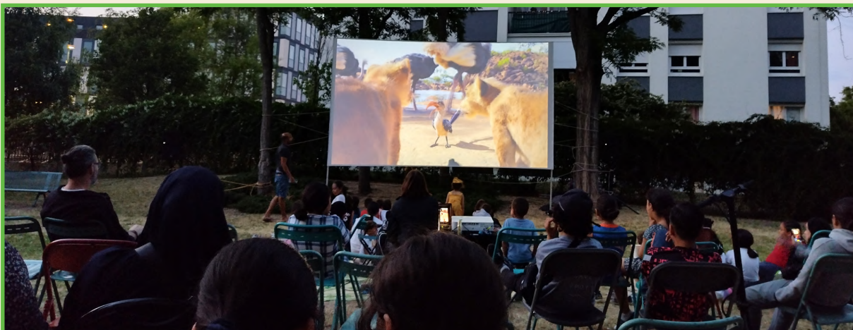
Projection du Roi lion (Jon Favreau, 2019) à Argenteuil, le 09/06/2023

À Argenteuil et Neuilly-sur-Marne, les projections ont été précédées de buffets organisés par des associations de locataires.