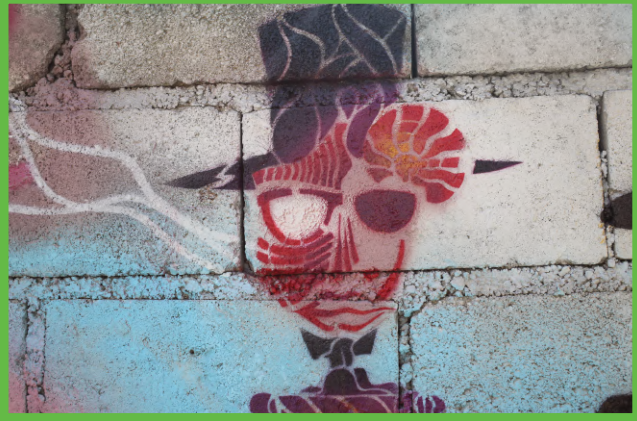
Port-au-Prince, chercher la vie