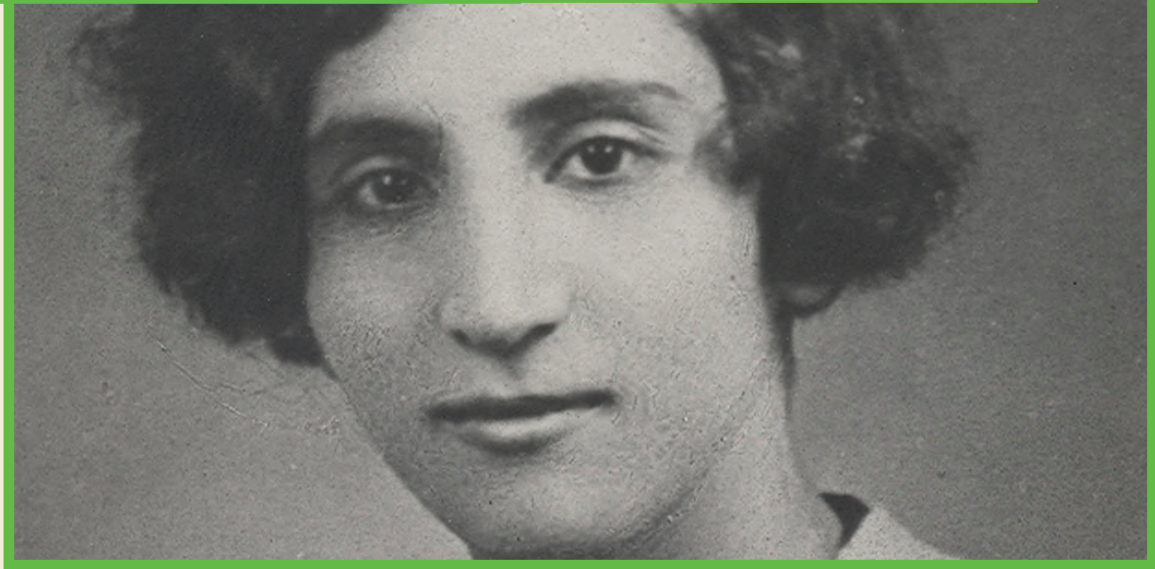
LASS disparait