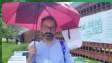
BENJAMIN BIBAS COORDINATION