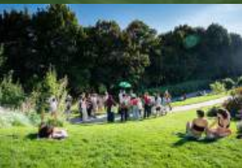
Parc de Belleville Paris 20e