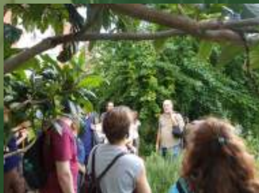
Couleurs et senteurs Jardin Luc Hoffmann - Paris 19e