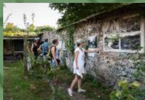
Jardin sur le site des Murs à pêches Montreuil (93)

L'objectif des visites est de permettre aux citoyens de connaître les lieux d'initiatives dédiés au jardinage écologique, et de leur donner envie de s'y impliquer. Plus largement, elles sont un moyen de diffuser une connaissance des espèces végétales et animales qui habitent la ville, ainsi que de leurs interactions, entre elles et avec les humains.