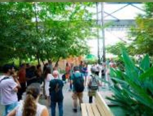
Jardins Rosa Luxemburg - Paris 18e

Les associations œuvrant dans les jardins (Vergers urbains, Ferme du rail, Jardin des Lyanes, Le Sens de l'humus) y présentent aussi leur fonctionnement, leurs engagements et leurs valeurs : jardinage écologique, convivialité, lien et partage entre les générations et les cultures.