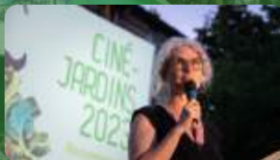
MARINE CERCEAU COORDINATION