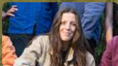
VALENTINE AUROUX COMMUNICATION