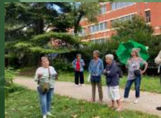
Parc Josette et Maurice Audin Bagnolet (93)