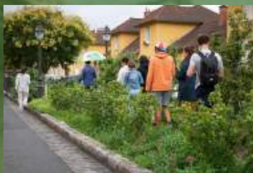
Cité-jardin Stains (93)