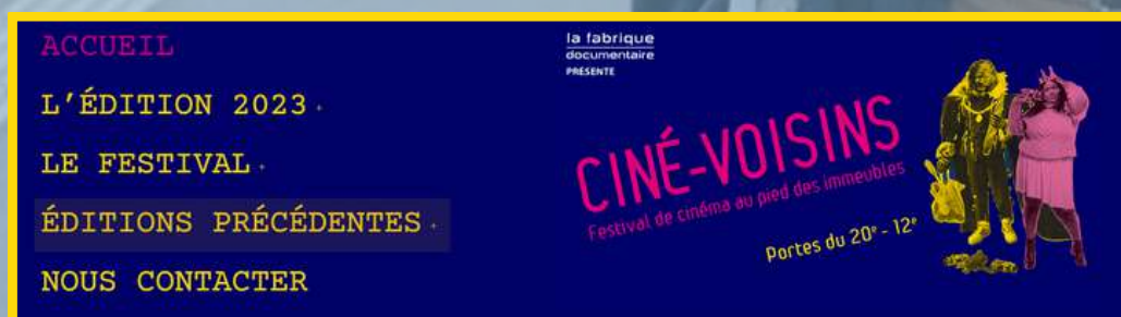
Photo de la nouvelle version du site de ciné-voisins

La Newsletter de Ciné-voisins permet à ceux qui le désirent de se tenir au courant de l'actualité du festival. La ou l'année dernière le festival recensé 1721 personnes ayant souscrit à cet outil de communication, nous avons franchi ensemble cette année la barre des 1850 inscrits. 129 personnes nous ont donc rejoint cette année pour se tenir au courant de la suite du festival et de ses soirées ainsi que des éditions futures.