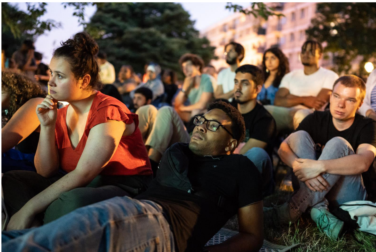
Projection Ciné-Voisins dans le quartier Python-Duvernois (Paris 20 e ), le 21 juillet 2022

Depuis 2015, année de la première édition du festival Ciné-Jardins , la fabrique documentaire développe une action d'éducation populaire dans le Nord-Est parisien pour favoriser l'expression des habitant·e·s les moins visibles, contribuer à une prise de conscience écologique plus large, et créer du lien entre personnes de toutes origines et de toutes conditions . Cette action documentaire est conçue à notre initiative propre ou dans un dialogue avec des acteurs publics : Etat, collectivités locales (Ville de Paris, mairies d'arrondissements et des communes proches...), organismes et bailleurs sociaux (CAF, Paris Habitat, RIVP). L'action, dans son ensemble, consiste en plusieurs événements proposant des projections de films, surtout documentaires, accompagnées d'un moment de convivialité et d'un temps d'échange autour du thème de la soirée.